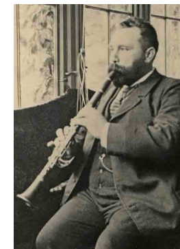
Klarinettist Richard Mühlfeld

1890 meende Brahms met pensioen te gaan: 'Ik heb genoeg gewerkt, laten de jongeren het nu overnemen'. Hij had een vergeefs aanzoek aan de toen 28-jarige mezzo-sopraan Alice Barbi gedaan, leerde de klarinettist Richard Mühlfeld kennen en begon uit pure bewondering weer kamermuziek te schrijven voor klarinet. Het bekende verhaal. Het klarinettrio kent duisternis en gouden licht, het is rijk aan thema's.